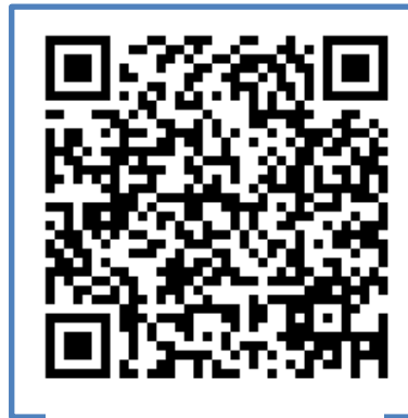
QR al procedimiento

https://www.mscbs.gob.es/profesionales/saludPublica/ccayes/alertasActual/nCov-China/